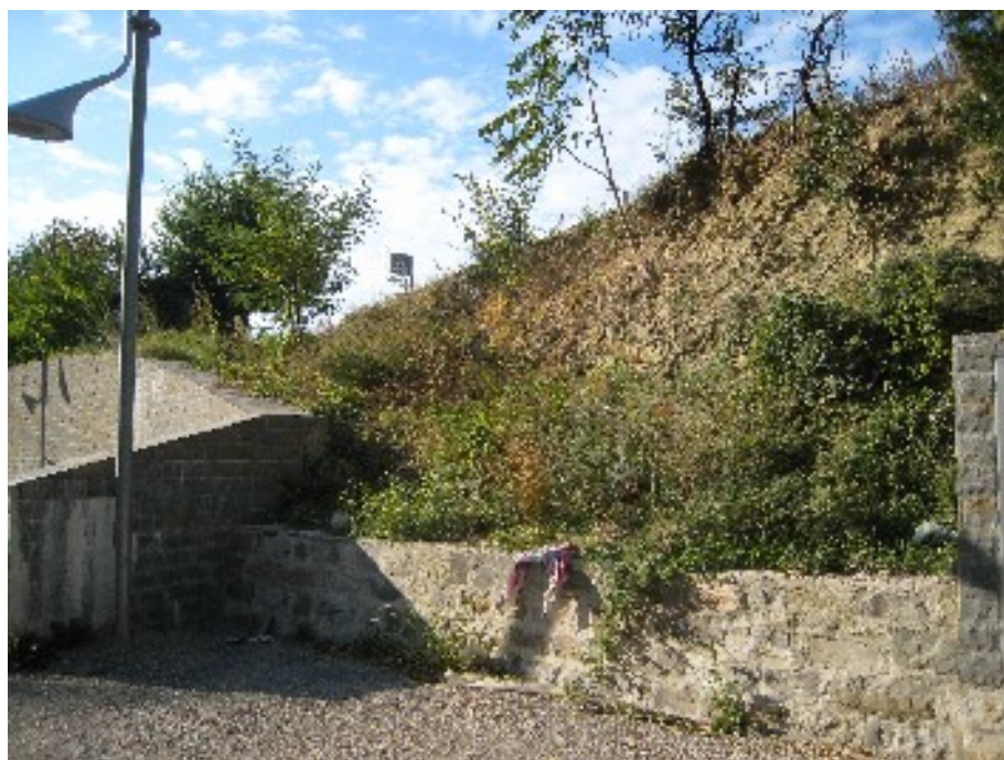
foto 2: punto in cui realizzare la rampa di congiunzione di via Orlandini con il terminal di partenza