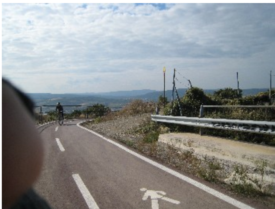
foto 3: il tratto in salita appena prima del sovrappasso sulla grande viabilità

Il tratto in questione è un tratto in forte pendenza e con curve dove NON è presente il marciapiede. Sarebbe quindi opportuno, per ragioni di sicurezza, separare in questo tratto i pedoni dai ciclisti realizzando sul terreno a monte della ciclabile un sentiero per pedoni con il posizionamento di adeguata segnaletica. Le foto seguenti illustrano il tratto di ciclabile (foto 3) dove l'uso promiscuo può essere pericoloso e la possibile area dove tracciare l'itinerario pedonale (foto 4).