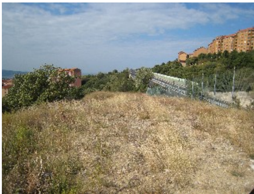
foto 4: il tratto a monte della ciclopista dove tracciare un itinerario pedonale separato dal percorso ciclabile