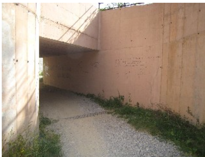
foto 5: assenza visibilità in curva e fondo incoerente sottopasso provinciale