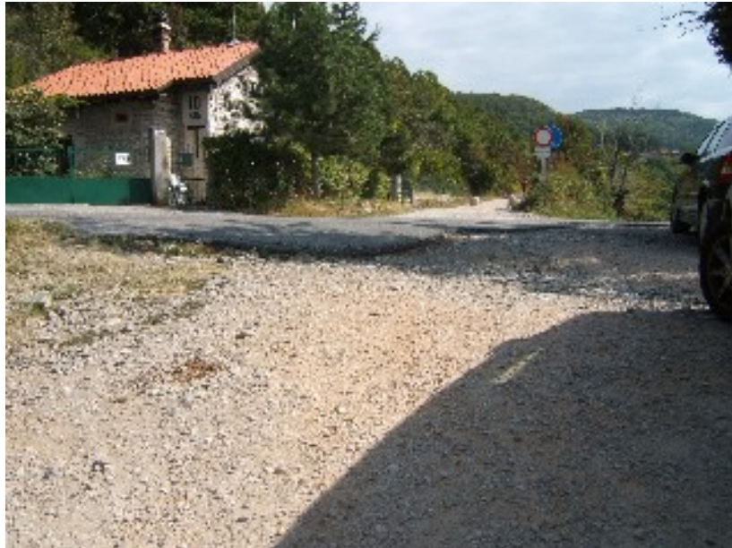
foto 6: erosione del fondo in prossimità intersezione con strada provinciale Mocco'

In diversi punti di intersezione fra la ciclabile e la viabilità stradale si è notata un'erosione del fondo della pista in prossimità del nastro stradale asfaltato. Si richiede pertanto di ampliare l'asfaltatura ad un paio di metri dalla pista con creazione di cunetta per la raccolta e smaltimento dell'acqua. Nella foto 6 la situazione dell'incrocio della ciclabile con la strada provinciale di Mocco'.