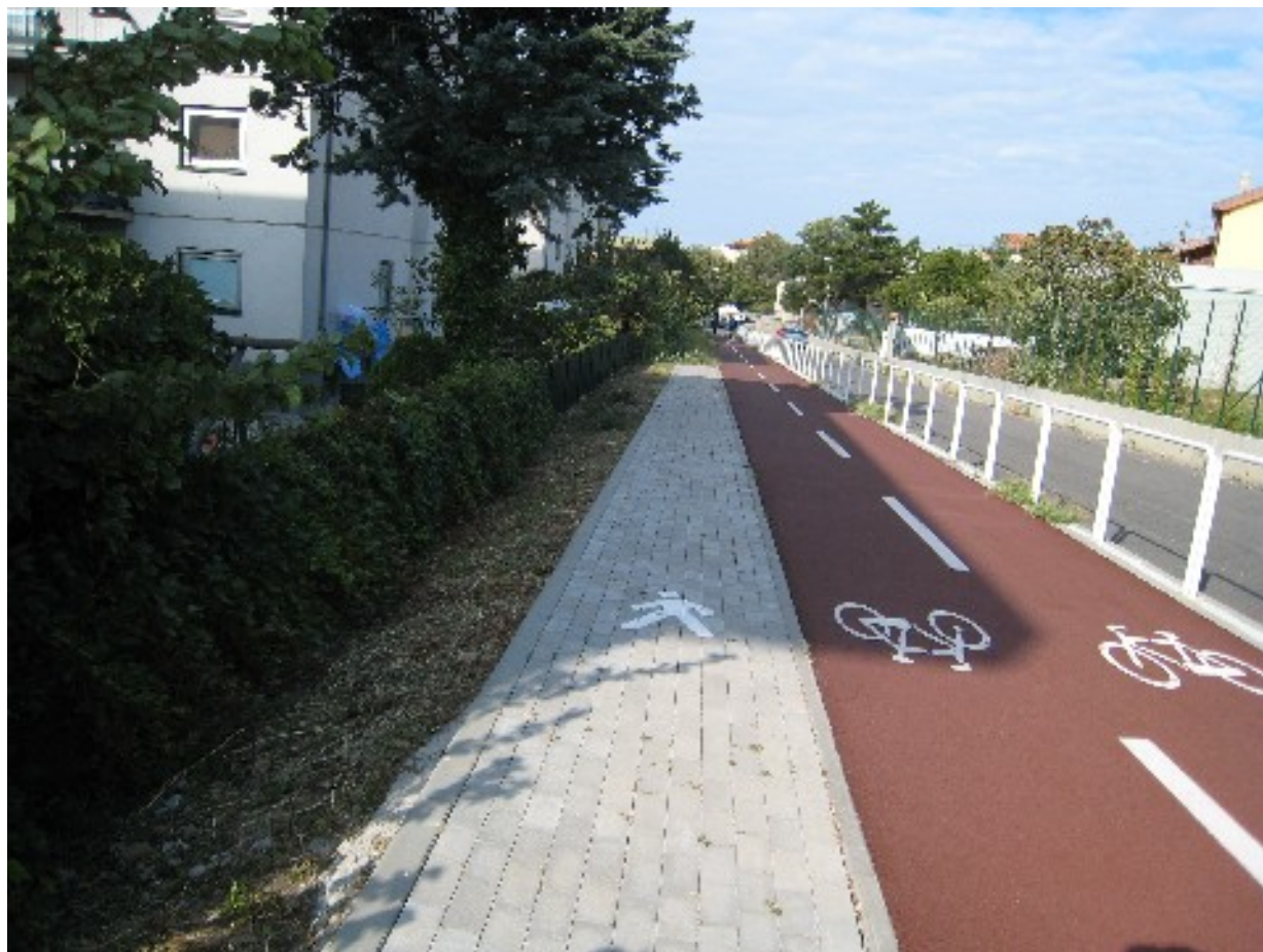
foto 7: un tratto di pista ciclabile perfettamente pulito. Si noti la linea precisa di fine lavoro.

Per quel che riguarda il delicato problema della manutenzione ordinaria vogliamo qui segnalare un aspetto molto positivo rilevato in alcuni (purtroppo rari) punti della ciclabile dove la manutenzione è molto probabilmente curata da persone che vivono ai lati della struttura: ne è esempio chiaro la foto numero 7 che testimonia questo processo di autogestione che andrebbe studiato e ulteriormente incentivato.